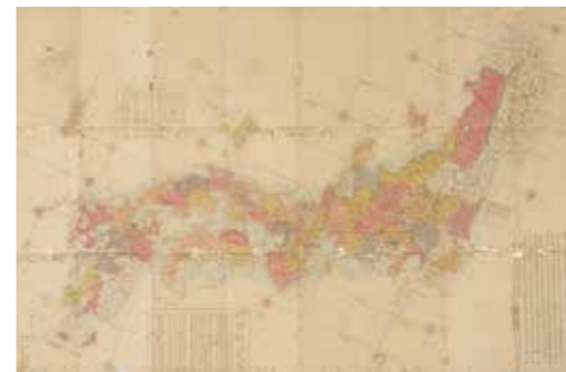
▲長久保赤水作 改訂日本輿地路程全図 古河市指定文化財

特にイベントの一つ「テクニカルツアー」は、最先端の科学技術に触れられる研究施設や文化財と