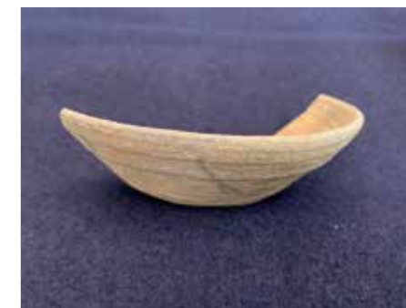
▲浜ノ台窯跡出土の須恵器。水平方向に成形の跡が見える