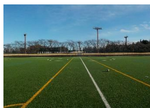
古河市サッカー場