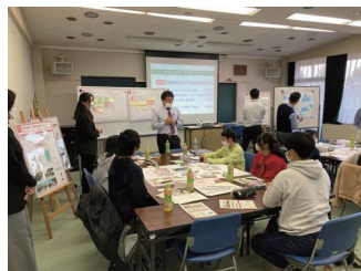
中高生ワークショップの様子