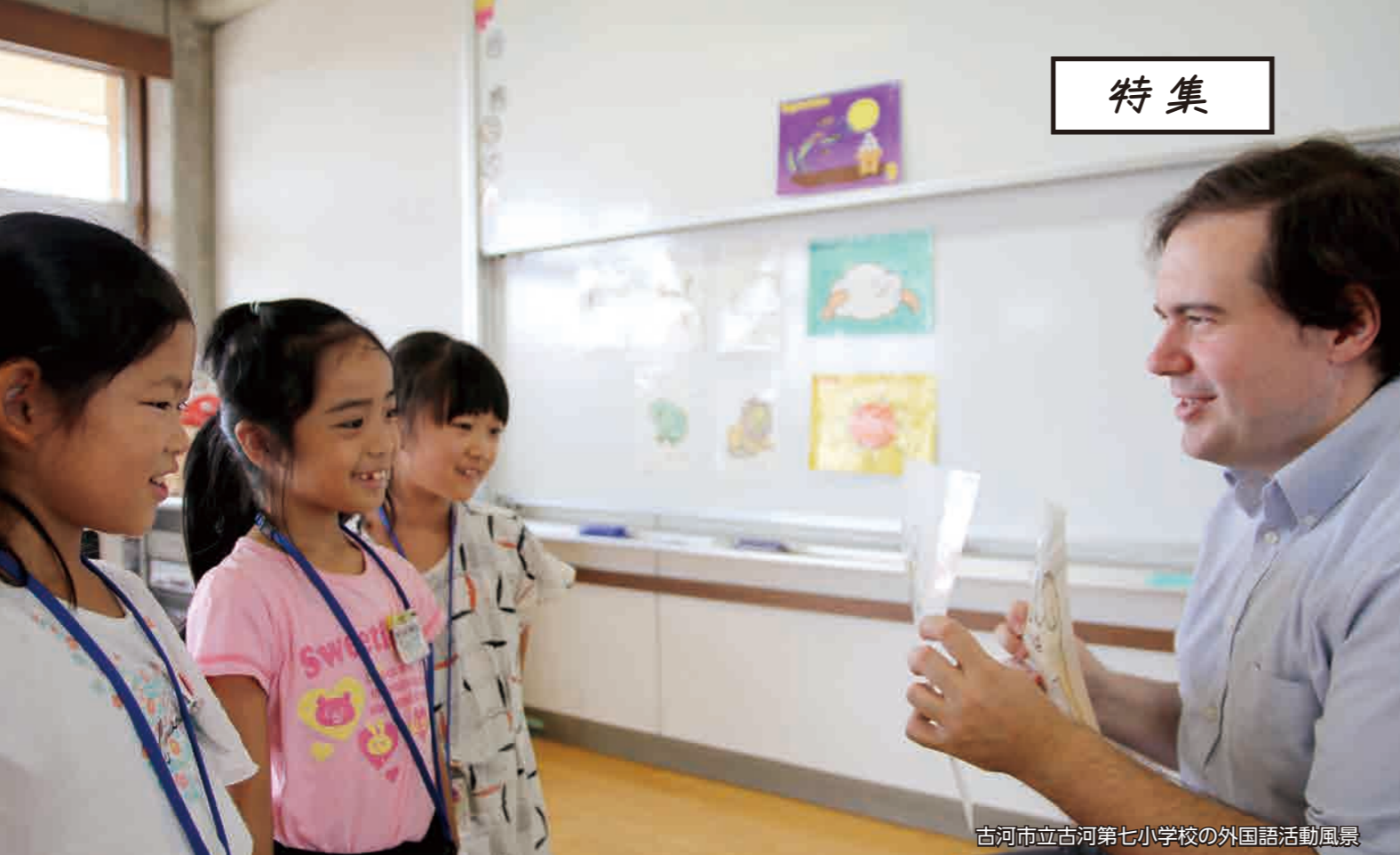
古河市立古河第七小学校の外国語活動風景