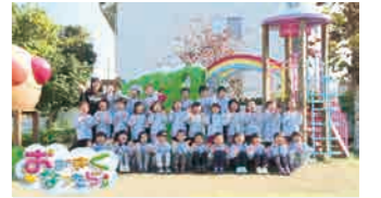
年長園児出演番組「おおきになったら」

「古河密着」を合言葉に、古河ケーブルテレビが取材・放送する地域情報専門チャンネルです。学校行事、お店紹介、議会放送、花火大会中継、園児が将来の夢を発表する番組など、多岐にわたる情報を放送しています。