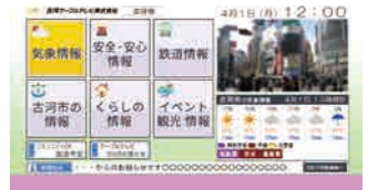
コミュニティチャンネル「データ放送」

市と古河ケーブルテレビは、災害時にコミュニティチャンネルから緊急情報を発信することにより、災害時の被害の予防、迅速な避難、市民の安心・安全の確保等を目的とした協定を締結しました。