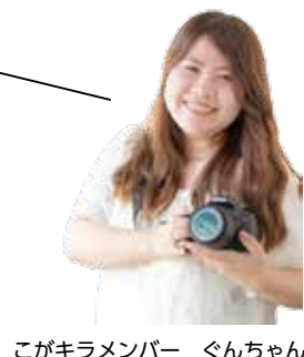
こがキラメンバー ぐんちゃん

【店舗概要】 場所：古河846-1 営業時間：17時30分～22時30分 定休日：水曜日 電話：32-8841