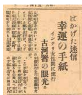
▲当時の新聞「ばかげた迷信 幸福の手紙」(昭和14年)

11(1922)年1月ごろ、突如としてこの手紙は現れたという。郵便制度という仕組みを用い、書き写されることで繁殖し進化した。戦争があれば戦争終結と平和を願ったものとなり、祈願をこめた呪術としてののだという。とりわけて、その本質を同一の文章を書き写す行為と見ている。