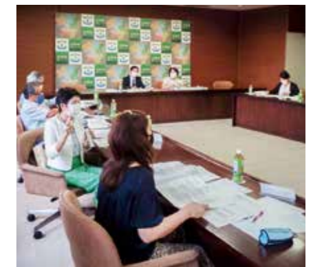
▲男女が共に活躍できる社会を目指して活発な意見が交わされています