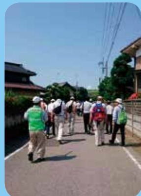
▲出前講座を活用した防災講習

地域の人たちが安全に避難できるよう、啓発活動や避難要支援者の手助けを行う中田町自治会の皆さんに話を伺いました。