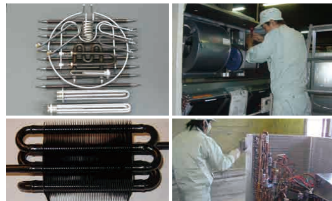
▲当社製品[電気ヒーター(左上)・カチオン電着塗装(左下)]およびエアコンのカスタマイズ作業風景