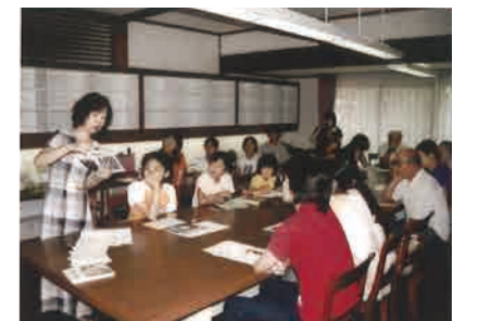
▲古河文学館での作品展に合わせた講演