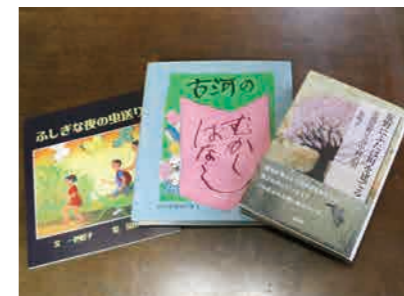
▲作品をぜひ、ご覧ください