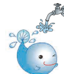
水道事業キャラクター 思川みずたろう