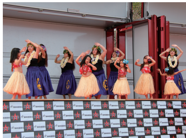
▲フラダンスを披露するテーマオテモアナの皆さん

会場には多数の模擬店が出店したほか、ステージイベントやこども職業体験、ちびっこコーナーなどを実施。両日とも多くの人でにぎわい、子どもから大人まで幅広い年代の人が楽しんだ2日間となりました。