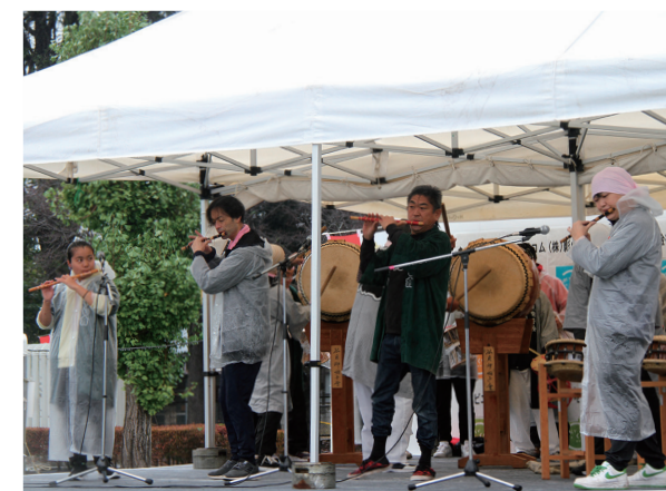
▲沼影・谷貝お囃子会による演奏

当日は地元企業や飲食店による多数の模擬店が並び、来場者は地元の味覚を堪能するなど、古河の秋を満喫。またステージでは、地元団体によるお囃子やダンスなどが披露され、会場を盛り上げました。