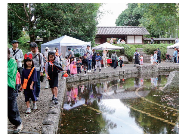
▲思い通りの仮装でハロウィンパレードを楽しむ参加者

10月19日、古河歴史博物館周辺で「出城ノモリ～みんなのMarket～」を開催しました。