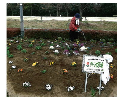
▲古河公方公園内の花壇へ植栽活動