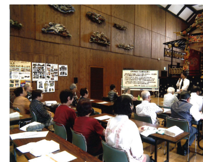
▲活動方針を決める総会の様子