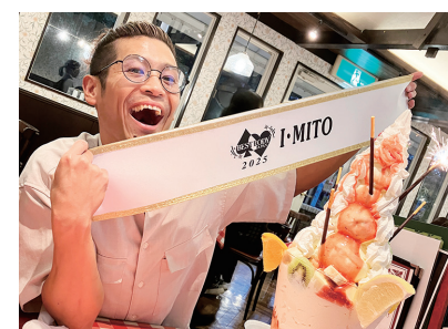
▲大会後は大好きなスイーツを爆食