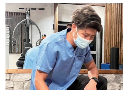
▲現在も企業向けに救命講習を実施