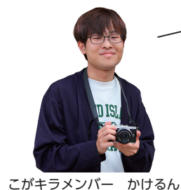
こがキラメンバー かけるん