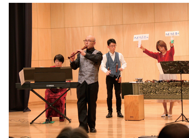
▲「[与作]」の演奏では参加者もかけ声で参加しました

12月14日、野本電設工業コスモスプラザで「古河市民大学魅力ある楽器の世界～リコーダー編～」を開催しました。