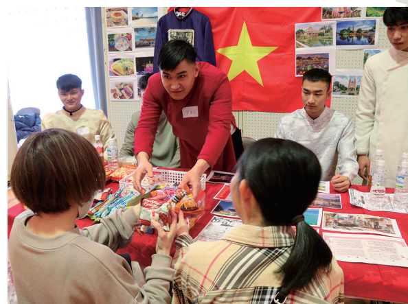
▲ベトナムブースでは民族衣装のアオザイを着てお出迎え

12月14日、共和電設とねミドリ館でウィンターフェスティバル2025を開催しました。