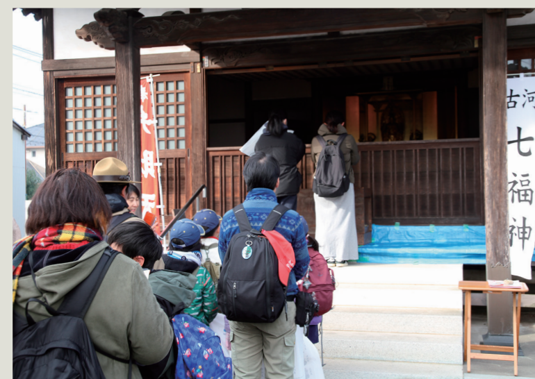
▲弁財天が祭られている徳星寺を祈願する参加者

市内外から多くの参加者が訪れ、約2時間(3.5km)のコースを自由に歩きながら巡拝。1年の幸福や無病息災を祈願するため、長い行列ができました。また、各寺社では地域の人たちが甘酒やお茶などを振る舞い、参加者は体を温め次の巡拝先へと向かいました。