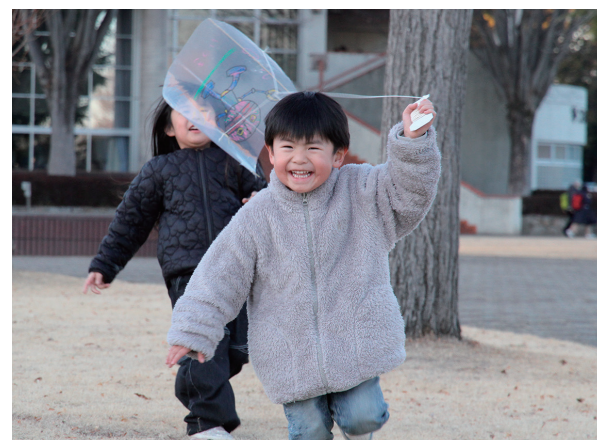
▲お姉ちゃんと一緒にたこ揚げをする男の子

当日は35人の親子が参加し、好きなキャラクターや動物などを思い思いに描き、世界で一つだけのオリジナルたこを制作。子どもたちは完成したたこを空高く揚げようと、元気いっぱい走り回っていました。