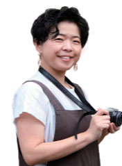
こがキラメンバー クミ

昭和2年に『友情の証』としてアメリカから贈られたお人形。その後戦争が始まったため、敵国の人形として多くが処分される中、当時の古河幼稚園の園長先生が守りぬきました。この実話は『青い目の人形メリーのねがい』という紙芝居になり、平和と友情の尊さを今に伝えていきます。紙芝居は市内図書館等で貸し出しを行っていますので、ぜひ、ご利用ください！