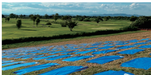
▲本部前堤防斜面席