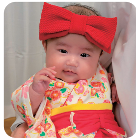
福島もあちゃん (令和7年12月生まれ)