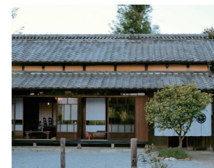
▲古民家を改装した茶寮 HANARE