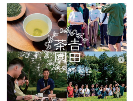
▲1日中茶園で遊べるプロジェクトです