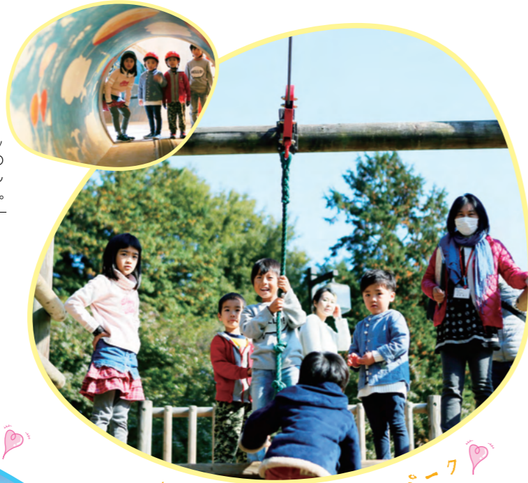
森の中にある小さなテーマパーク