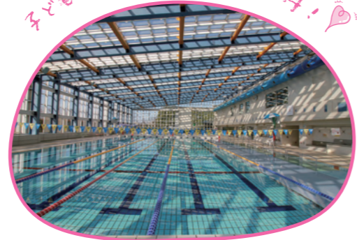
子どもの付き添いなら大人は無料！

住所：下大野 2528 TEL：92-9000 時間：火-土 9:00-20:00 日 9:00-16:00 料金：一般：400円 小中学生：200円 幼児(3歳以上)100円 ※時期により時間や料金が変動します。