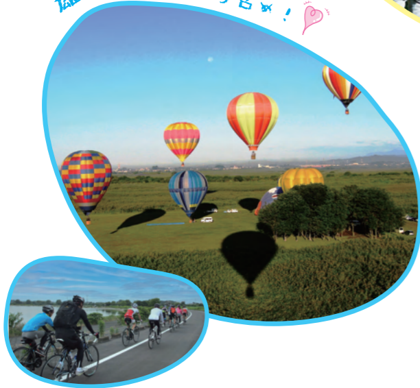
雄大な自然をひとり占め！