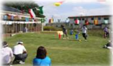
運動会、クリスマス会も実施しています

開所時間帯を弊社のカレンダーに合わせて利用しやすくしています。また、育休明けの職場復帰をよりスムーズにすすめることができるなどメリットが大きいです。