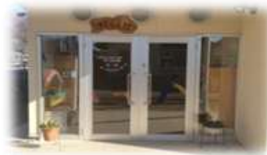
開園してから 7 年目を迎えました

A:社員の子育て支援策の一環として、平成 20 年に古河事業所近接に保育所「さくらんぼ」を設置しました。