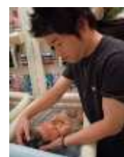
2014 子育てする男性部門 最高得票作品