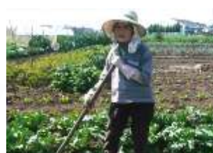
2014 働く女性部門 最高得票作品