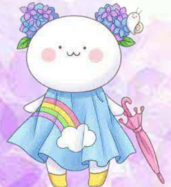
県西生涯学習センター 公式キャラクター あじまる

主催:下館シニアライオンズクラブ 茨城県県西生涯学習センター 茨城県教育委員会 共催:県西おやじの会