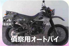
偵察用オートバイ