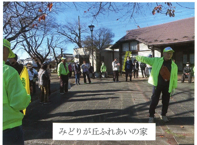
みどりが丘ふれあいの家