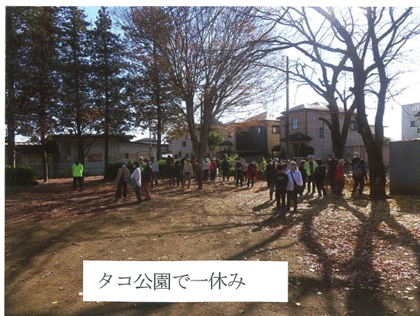
タコ公園で一休み