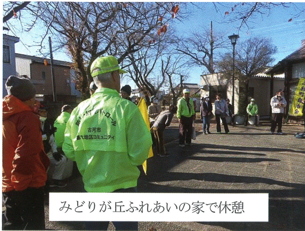
みどりが丘ふれあいの家で休憩