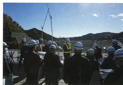
強風による歩行訓練