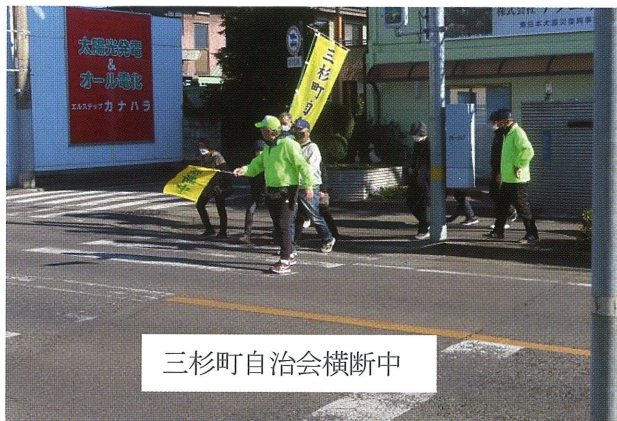
三杉町自治会横断中