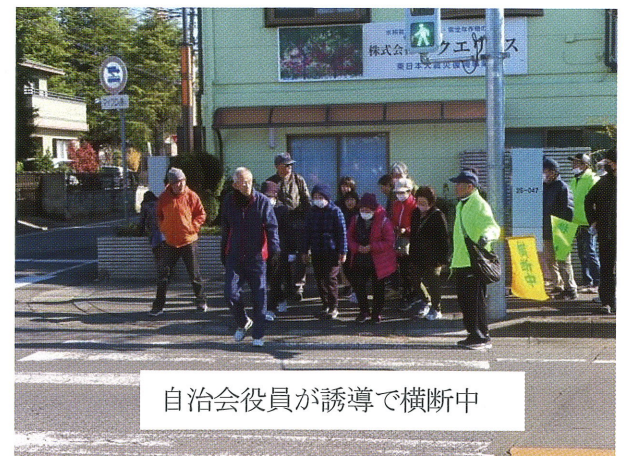
自治会役員が誘導で横断中