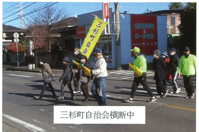
三杉町自治会横断中