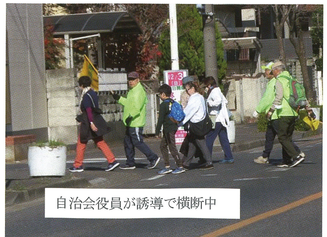
自治会役員が誘導で横断中