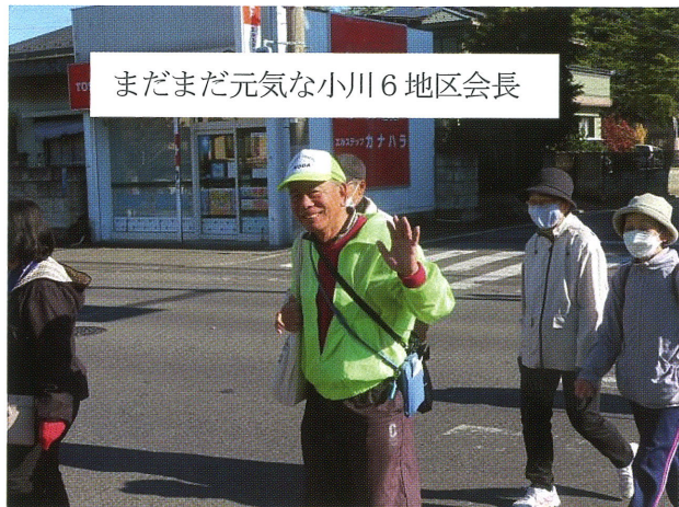
まだまだ元気な小川6地区会長