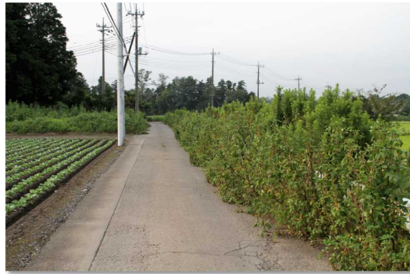
▲車が通ると歩けない程生え茂った雑草

猛暑が続く、8月28日。小立野第二行政区の役員さんが二学期が始まる小学生のために通学路の除草作業を行った。