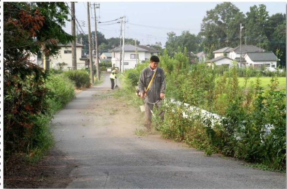
▲水分を補給しながらの除草作業お疲れ様