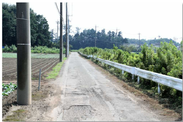
▲見違える程ピカピカになった通学路

早朝の作業であったが、流れる汗とホコリにまみれて奮闘。「子ども達のためだから」と笑顔を見せてくれた。