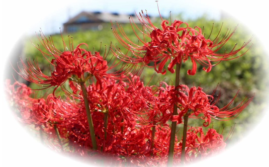
彼岸に咲くからヒガンバナ 今年も少しずつお彼岸に開花

お彼岸を迎えた9月19日、きらめき湖の畔に真っ赤な彼岸花が咲いていた。彼岸の頃に咲くことから「ヒガンバナ」と呼ばれ八俣地区でも水田の畦や道端にハッとするような鮮やかな色と形で「お彼岸」の到来を告げてくれている。別名「曼珠沙華」(マンジュウシャゲ)はサンスクリット語で「赤い花」の音写で、法華経では「天上の花」とも言われている。有毒な球根を利用してモグラ除けとして畑の畦などに植えたという説もある。ヒガンバナ科ヒガンバナ属 多年草 原産地は中国大陸 日本列島全域で生育