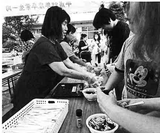
どんどん食べてね～