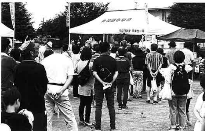
大勢の皆様が参加しました