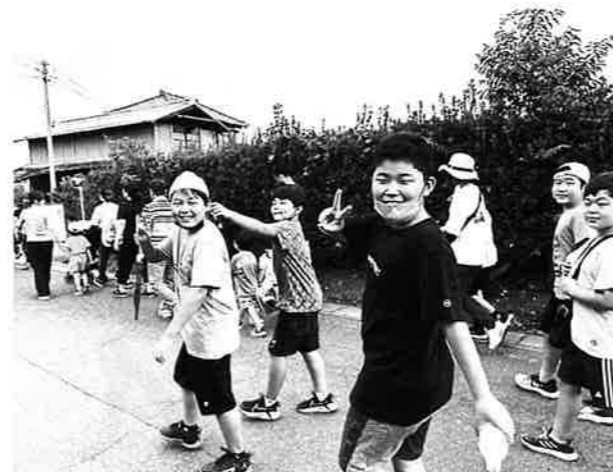
子供達も楽しく歩いています♡