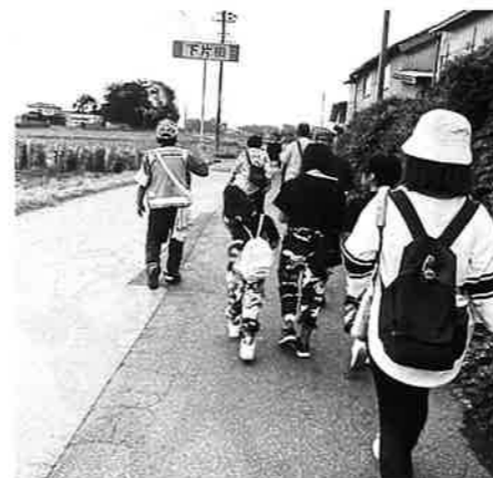
区長さんを先頭にみんなでウォーキング 下片田

★ 大和田小学校の北門が、スタート及びゴールとなります。 ☾ 日本庭園入口は、庭園内の東屋付近にあります。