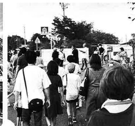
みなさん頑張ってます!!