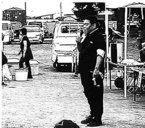
小曾根会長のあいさつ