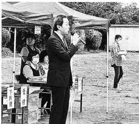
原副市長のあいさつ

いざ開始と思ったら、空からぼつりぼつりと：でも何とかな？。コースの中に野本電設工業様のそれは、それは素敵な日本庭園を見学でき、心が癒されました。親子キッズダンス(かっこよかったアー)、大和田囃子会の演奏(子供達とわきあいあい)、おいしいうどんやお菓子を食べながらのコミュニケーション、夕方にはダイナミックな花火見物(とつても、さらびやか)。 大和田小学校の先生、交通安全協会、自警団、広域消防分団の方々の協力を頂き無事大会を終える事ができました。誠にありがとうございました。