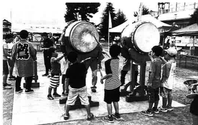
子供達も太鼓に興味津々!!