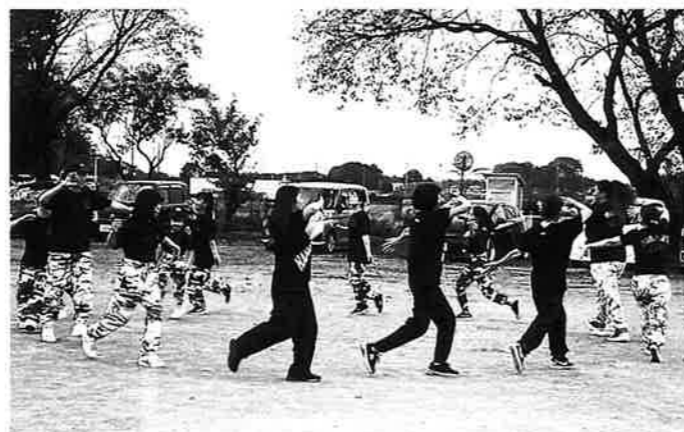
カッコイイダンス!!