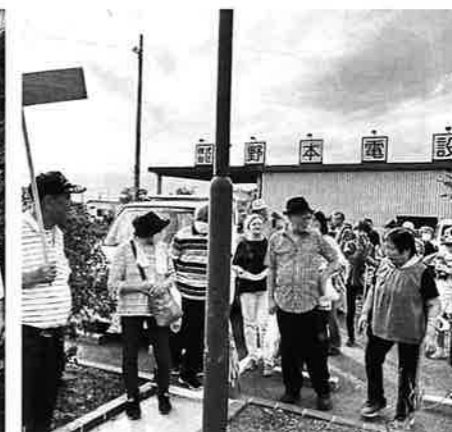
日本庭園前でひと休み。