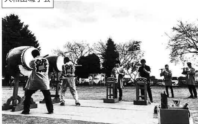
力強いお囃子でした