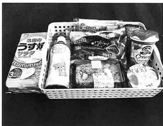
たくさんいただきました。