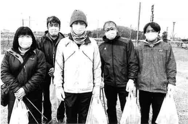
先生方、ご協力ありがとうございます。