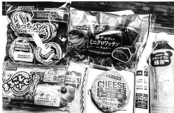
おいしい昼食ありがとうございます。