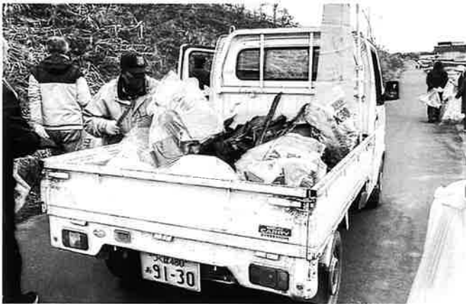
たくさん集まっています。