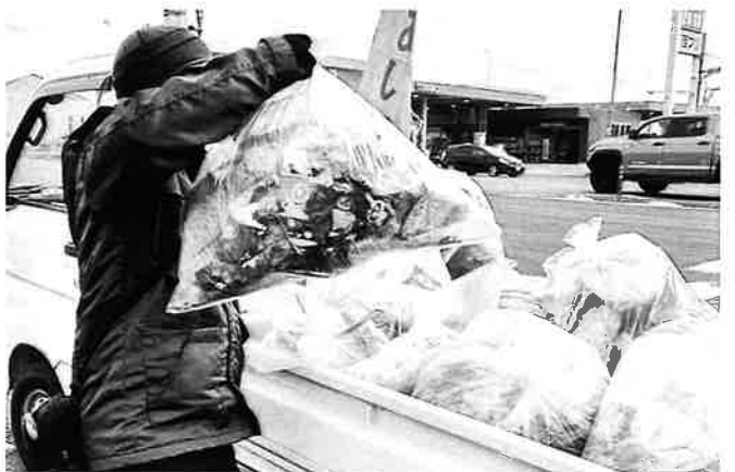
今年もこんなにありました。