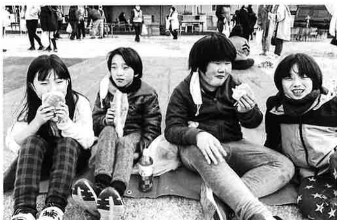
子供達も喜んでいます。