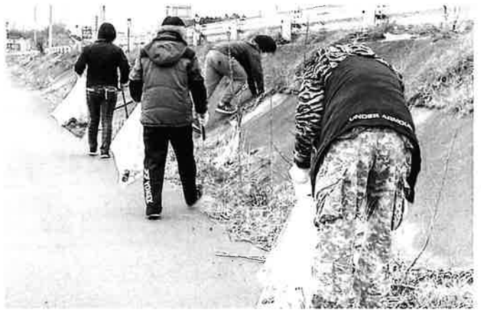
みなさん頑張ってます。