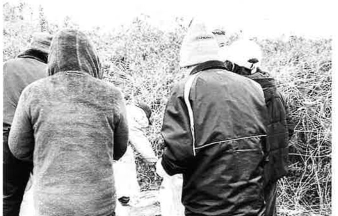
寒い中ご苦労様です。