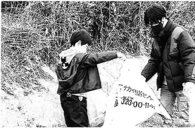
子供達も頑張ってます。