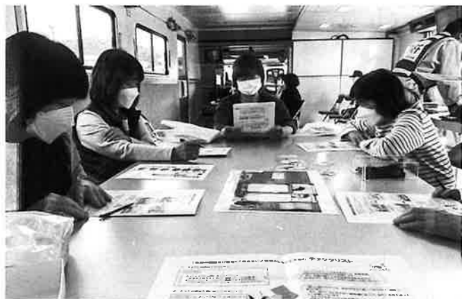
自宅の危険度チェック