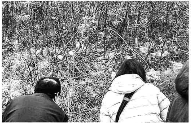
ペットボトルの山！！