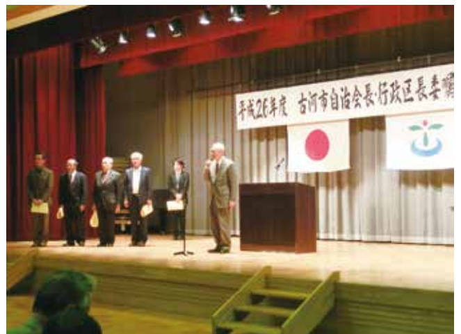
あいさつを述べる橋野様と受彰者の皆様