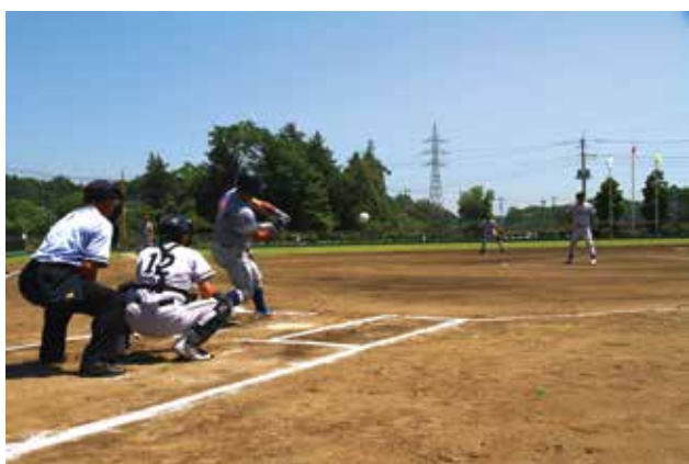
熱戦の様子(6月1日 上大野グラウンド)

チャレンジ男子39チーム、女子5チーム、エンジョイ44チーム、応援団を含め約2,500人の参加のもと熱戦が展開されました。