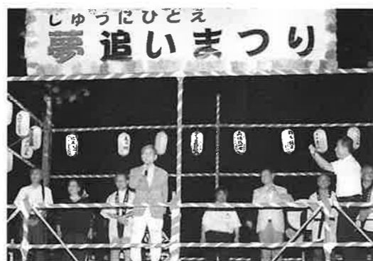
ご来賓の皆様 お忙しい中、お越しいただき誠にありがとうございました