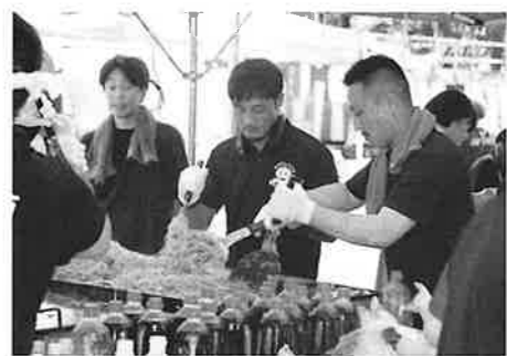
商工会の皆さん 中身たっぷり美味しくいただきました！