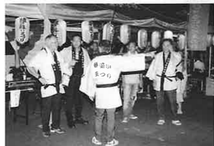
役員さんも新しいはっぴで ハッピー