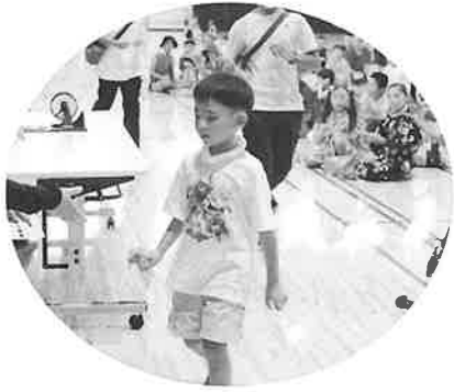
何がもらえるかな？