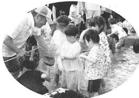
おじさんボクにも～