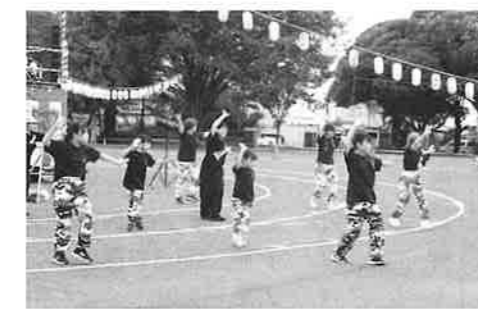
古河和舞祭りトルウィングの皆さん キレイのダンスありがとうございました ました(^^)