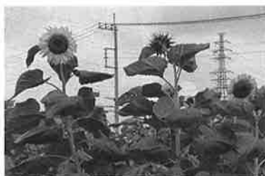
作業後のかき氷 美味しかった～！！