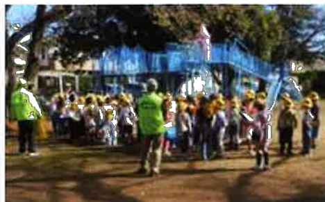
【三杉町の中央公園】

11月10日は2年生約70名が二班に分かれ図書館への課外授業を行った際に、それぞれ交通安全の為に旗振りと、道中の見守りを兼ねて活動に参加しました。私達もなにかあってはいけないと緊張して対応しましたが、無事に役目を終えてほっとしました。