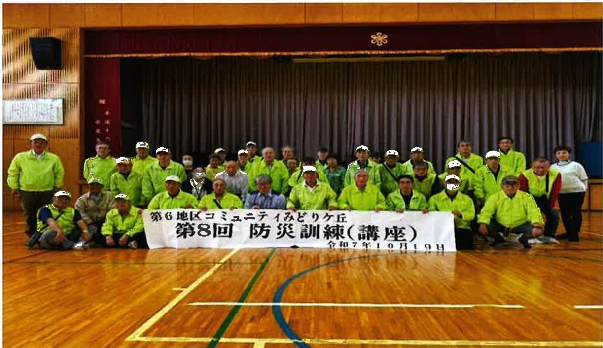
古河消防防災課の皆さんと第6地区コミュニティの役員