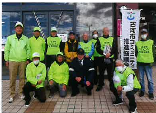
コミュニティ広報活動への参加 (左端が飯田会長)