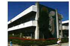
出典: 文部科学省ホームページ ( https://www.mext.go.jp/ )

コミュニティ・スクール(学校運営協議会制度)は、学校と地域住民等が力を合わせて学校の運営に取り組むことが可能となる「地域とともにある学校」への転換を図るための有効な仕組みです。コミュニティ・スクールでは、学校運営に地域の声を積極的に生かし、地域と一体となって特色ある学校づくりを進めていくことができます。