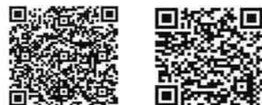
消防団についての情報 古河市消防団員の処遇