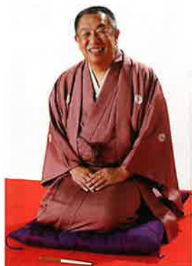
八代目 春風亭柳橋 師匠

現在の主な活動は新宿末廣亭・浅草演芸ホール等ですが、地元古河でもサンワックスホールスペースU古河で古河落語会(次回は2024年6月8日)を開催予定です。古河市の皆様に笑いと感動をお届けします。