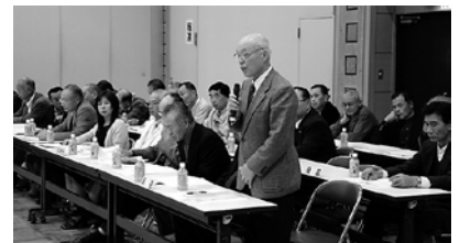
▲皆さんから貴重な意見をいただきました

予算については、全体事業費が214億円で、そのうち113億円は保留地処分価格で見込んでいますが、再計算も必要と考えています。いかに歳入を増やして歳出を減らすかを今年、来年に向けて見直していきます。完成時期については、抜本的な見直しをするため、現段階では言えません。事業費をどうするか、仮換地をどうしていくか、財源をどうするかを分かり次第、開示していきます。