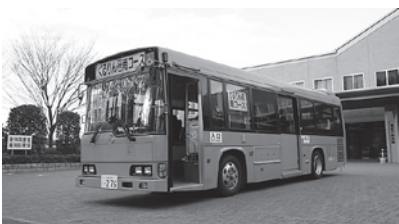
▲市内循環バス「ぐるりん号」

A 「市内循環バス」については、議会や市民の皆さんから総和・三和地区でも運行するよう要望が出ています。先進地の事例を見ますと、路線バスがなくなれば、地域に適した乗合運行手段を導入しているところもあるようです。今後、古河市全体への拡大にあたっては、どの地区でどのくらい需要があるか把握し、運行方式やルートはどうするのか、市民の皆さんの声を聞き、古河・総和・三和各地区のバランスや運行の効率性などを考慮し、検討していきます。