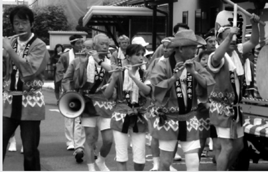
▲威勢の良いお囃子が響き渡る夏祭り

びます。そして、公園で消火訓練を実施。消防署員の指導で、実際にオイルパンに油を入れて火をつけ、消火器で火を消します。そのほか、三角巾を使った手当の仕方も消防署員から教えてもらいます。「訓練は誰もが経験できるように、毎年実施しています。災害時には、知識よりも体で経験したことが役に立ちますから」と木村区長が話すように、いつ起こるか分からない災害に対して地域で万全の備えをしています。