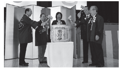
▲市長が来賓と共に鏡開きを行いました