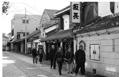
▲趣のある街並みを活用

なお、個人所有の古い建物(店、倉庫、塀)を市が修繕する制度はありませんが、歴史的建造物は市にとって貴重な財産ですので、保存すべきと思われるものについては、財政状況等を勘案した上で、今後検討していきます。