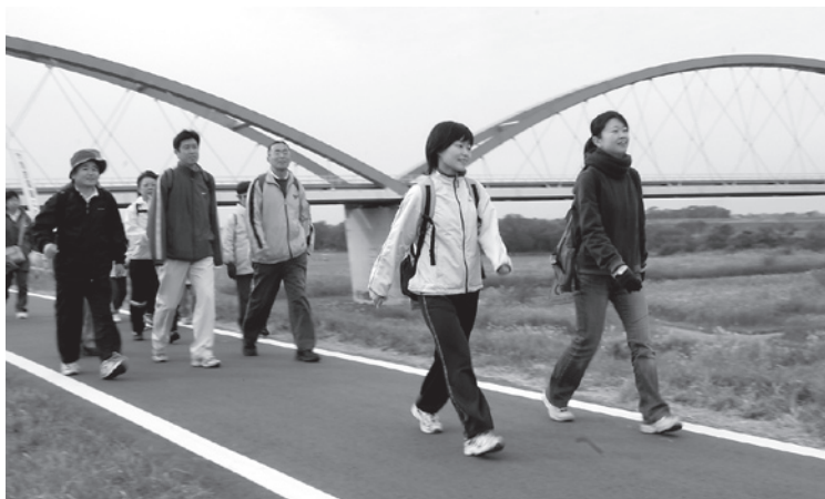
▲適度な運動で健康な体を保ちましょう (写真は昨年11月23日に開催された「ザ・ウォーキング&健康ジョギング」)