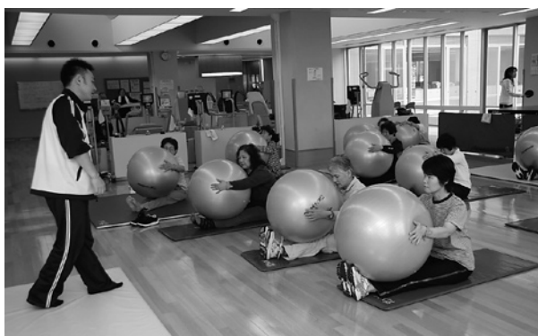
▲「健康の駅」ヘルストレーニングルームでは、さまざまな内容の体操教室も開催しています