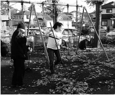
▲きれいで安全な公園をみんなの手で