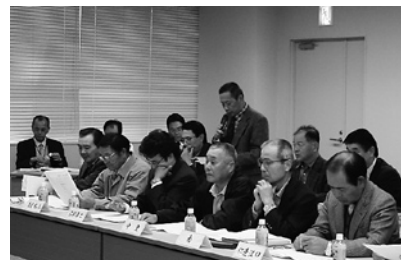
▲意見・要望を市政に反映させます

ています。旧三和町の時は道路幅が4.8m以上で側溝を付けて整備していましたが、新市としては4.0m以上で片側側溝を付けて整備、5.0m以上で両側側溝を付けて整備ということで決定しました。