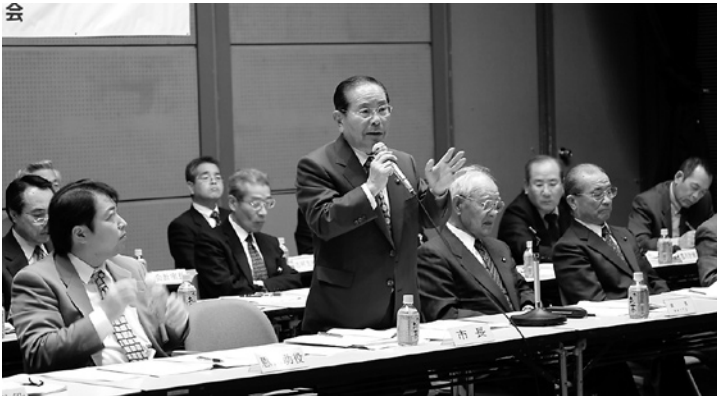
▲市民の皆さんとの対話を大切にしています

地域での意見や要望を聞き、行政に反映させるため、市政懇談会が古河・総和・三和の各地区で昨年11月に開催されました。