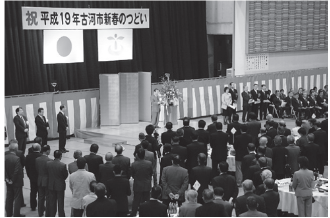
▲立食パーティー形式で開催

その後、「 きんせいかい 公聲会」による木遣り、鏡開きと続き、全員で乾杯。会場内では賀詞交換が和やかに繰り広げられました。