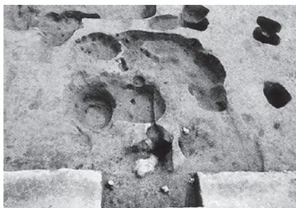
▲本田山遺跡で発見された第2号鍛冶遺構