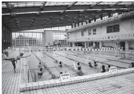
▲水中運動で気分も体もスッキリそう快