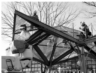
▲作業は高所作業車を使って行われました

12月13日、駅東口のシンボル「ゆきはな」の清掃が行われました。この清掃活動は、東京電力㈱古河営業センターの地域サービス事業の一環として例年行われているものです。通り行く人が見上げる中、ほこりの付いたモニュメントの天井や電球が、ピカピカに磨き上げられました。