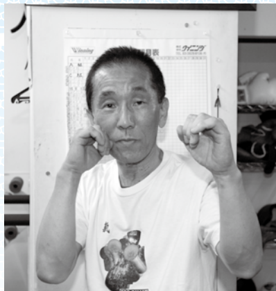
▲ファイティングポーズも決まっています

▶試合は1ラウンド3分。前半がシャドーボクシングで、後半が相手とトータルパフォーマンスを競います