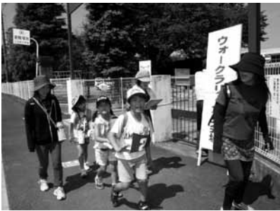
▲チームで協力して設問を解きながら、歩く楽しさの再発見をしました

コースは上辺見小学校を起点に約8km。途中には11カ所のチェックポイントが設けられ、そこで出される問題を解きながらゴールを目指しました。参加者は新緑の自然を満喫しながら市内の名所を巡りました。