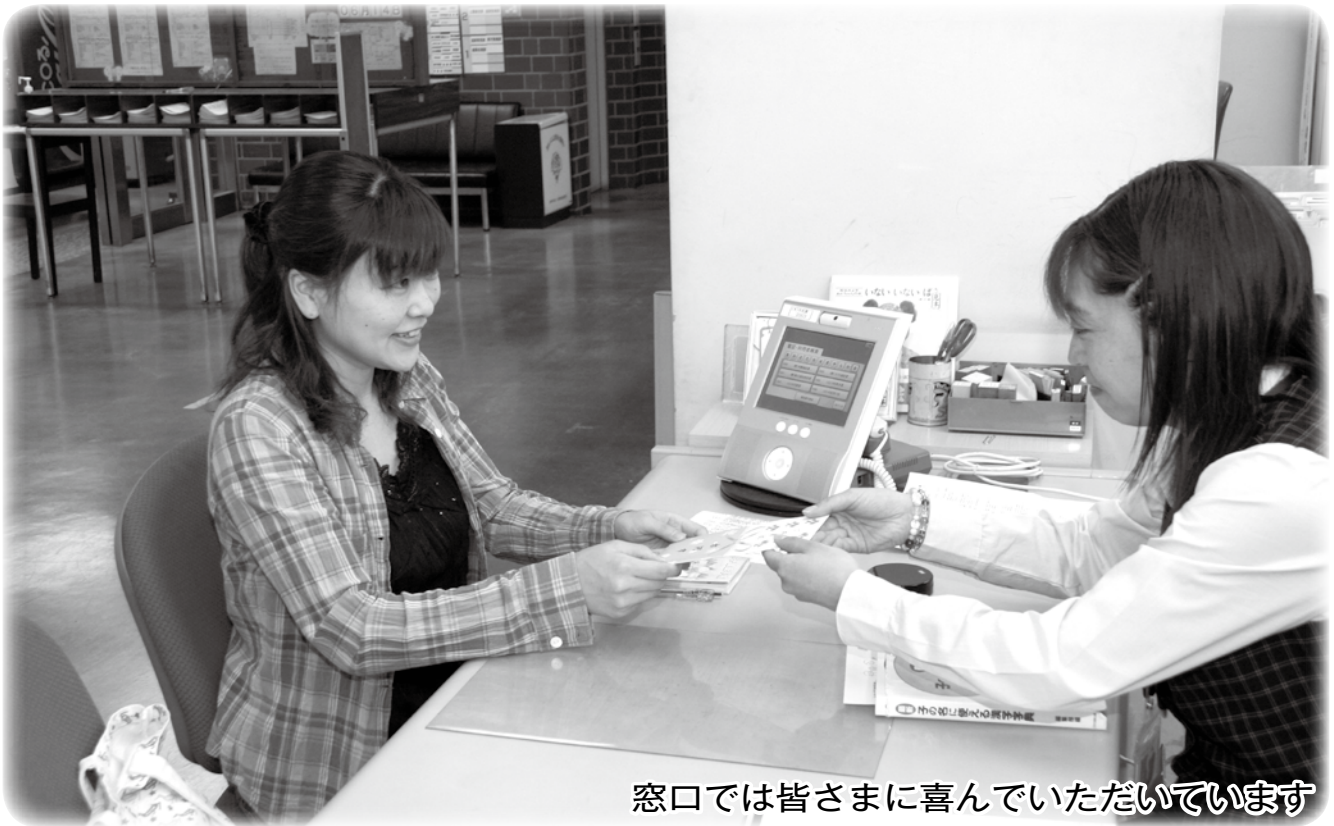
窓口では皆さまに喜んでいただいています