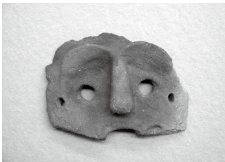
▲釈迦才仏遺跡出土土製仮面

出土した土製仮面は縄文時代後期のものと考えられ、長さ10.6cm、幅13.5cmを測ります。鼻は太く長い棒状で、縦長の鼻孔が表現され、弧状の眉とT字状に連結しています。両眼は内径1.6cmほどの円形で裏面まで貫通し、両眼の外側に両耳の痕跡があり、両眼脇のやや下方には紐通しの孔が貫通し、口は下半を欠損しています。左頬の口寄りには入れ墨あるいは髭を表現したと思われる彫り込みがあります。全体的に平板