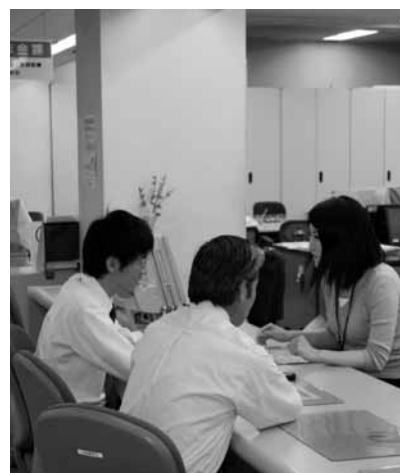
▲窓口での申請が必要になります