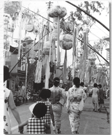
▲横山町の七夕飾り(昭和40年代ころ)

古河歴史博物館の玄関先には、7月1日から11日まで、七夕飾りの竹が立てられます。受付に用意された短冊に歌や願い事を書いて枝葉に飾ることができますので、この機会に星に願いをかけてみてはいかがでしょうか。ご来館をお待ちしています。