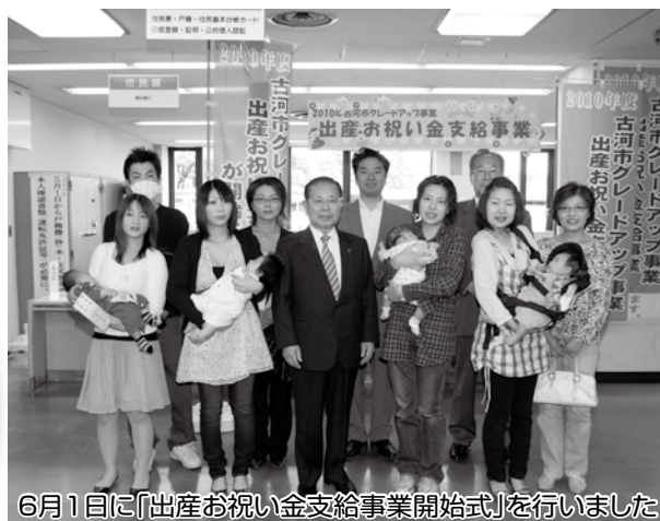
6月1日に「出産お祝い金支給事業開始式」を行いました