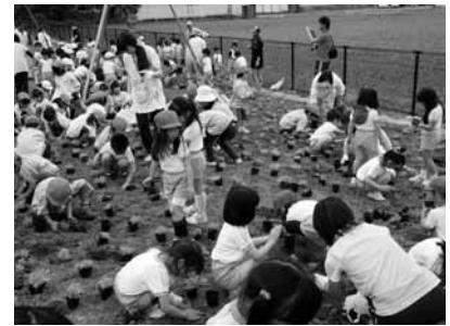
▲きれいな花のじゅうたんが一面を咲きそめる日が今から楽しみです