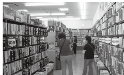
▲店舗を巡回する相談員

活動は古河支部、総和支部、三和支部とそれぞれに行われており、各支部とも年間約40回の定期街頭補導や地域における夏祭りや盆踊りの際の特別街頭補導、電話相談カードの配布、非行防止活動にかかわる啓発活動、環境浄化活動などを行っています。定期街頭補導では、各支部の青少年にかかわりが深いと思われる店舗、公園等を定期的に巡回し、多くの青少年との「ふれあい」を大切に、声かけ・相談を行いながら、青少年の健全育成につながるよう活動しています。そのほかにも、こどもまつりや古河関東ド・マンナカ祭り会場での青少年コーナーの設置や、さんわ青少年フォーラムなど、地域の子どもたちと一緒に交流活動をしながら、子どもたちの成長を温かく見守っています。