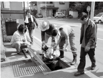
▲道路の側溝清掃はかなり苦労しました