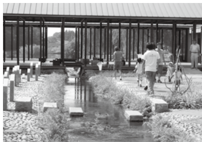
▲両岸に青々としげるミズワラビ。ナマスやタナゴがすみつくことも

夜の間も供給される流れによって細かい泥が運ばれ、石の間に積もり、水草が茂り始めます。これによって水の流れに緩急が生まれ、アメンボウ、ヨシノボリ(ハゼの仲間)、カラスガイなど、それまで水に流されていた沼の生き物たちがすみつき始めます。夏本番のころには、アメンボウも水面を覆うほどの大群に育ち、わずか2カ月で豊穡な生態系が創られます。