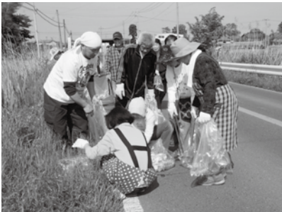
▲地域の人みんなで協力してきれいになりました