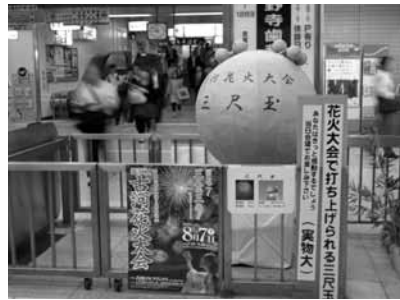
▲JR古河駅では、改札口の横に設置してあります