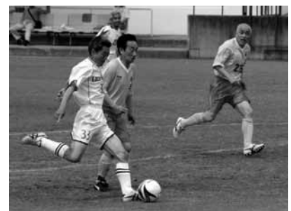
▲厳しいマークを振り切りシュート！

市内からは13チーム(チャレンジ部門3チーム・エンジョイ部門10チーム)が参加。チャレンジ40雀部門に参加したLAZOS KOGA FCAとチャレンジ50雀部門に参加したLAZOS KOGA FCCが見事優勝に輝きました。