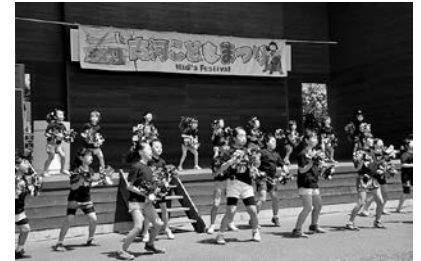
▲子どもたちが元気いっぱいのパフォーマンスをします(写真は昨年の「古河子どもまつり」)