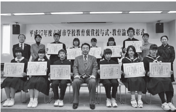
▲中学生の受賞者の皆さん