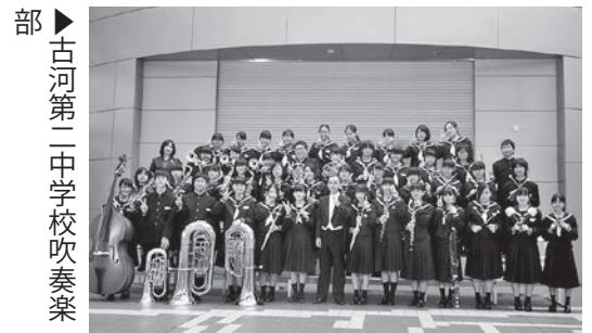
▶古河第二中学校吹奏楽部