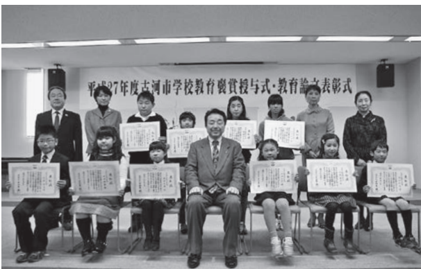
▲小学生の受賞者の皆さん

2月4日、三和公民館(三和庁舎3階)で古河市学校教育褒賞授与式・教育論文表彰式が行われました。作文、絵画、ポスターコンクール、標語、吹奏楽など芸術・文化の部門で優秀な成績を収めた児童生徒17人・5団体へ学校教育褒賞が授与されました。また、教育論文で優れた成績を収めた教諭36人が表彰されました。