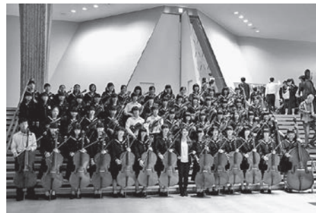
◀総和中学校S・オーケストラ部