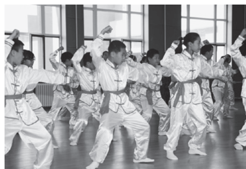
▲中国河北省発祥の武術「八極拳」は人気のスポーツです