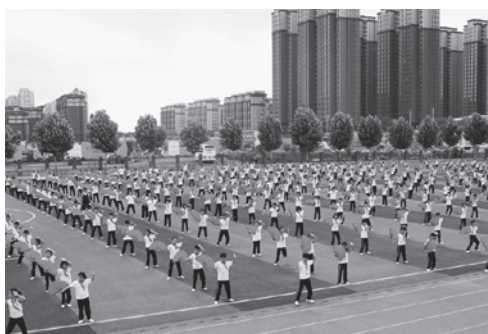
▲小学4～6年生800人による「太極扇」。一糸乱れぬ動きに圧倒されました