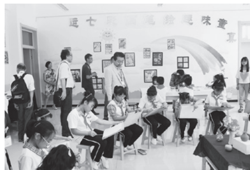
▲市内小学校を視察。芸術やスポーツに力を入れて取り組んでいます