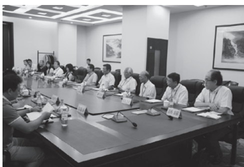
▲教育関係者との意見交換会