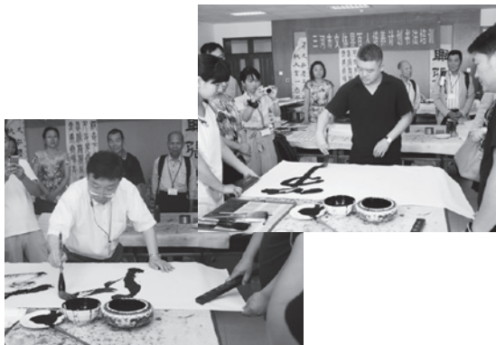
▲三河市民(上)と古河市民(下)が書道の腕前を披露。互いの心を通わせました