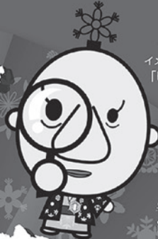
古河商工会議所 イメージキャラクター 「ゆきとのくん」