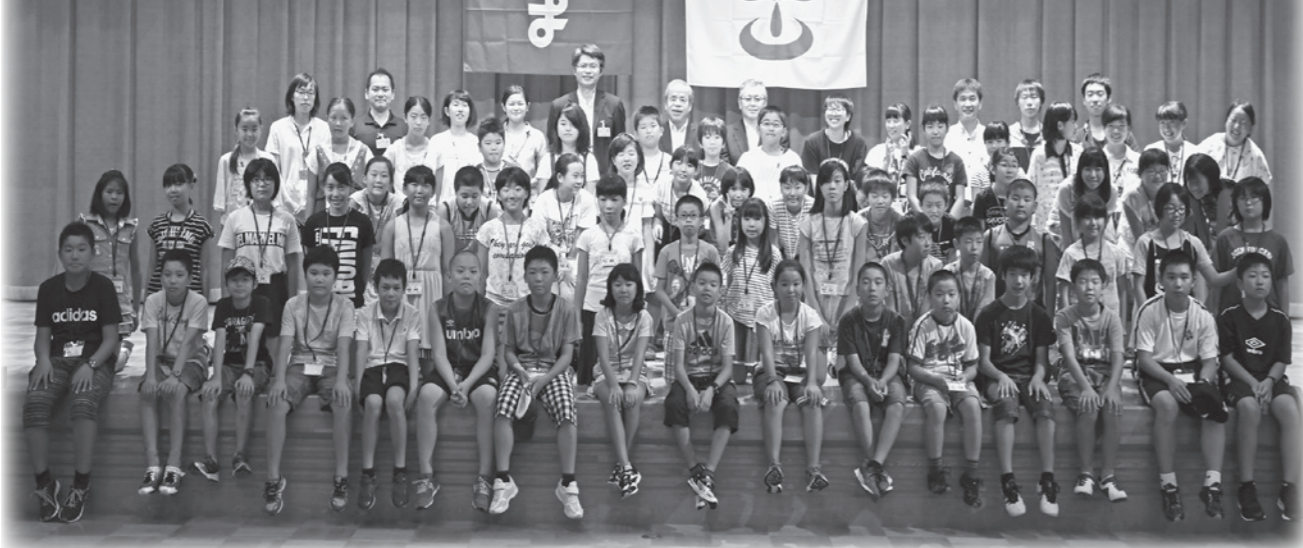
▲平成29年度真室川町との姉妹都市交流

近年、情報化の進展により子どもが被害者となる事件や若者による犯罪が増え、子どもの安全や若者の非行に対する人々の不安が高まっています。