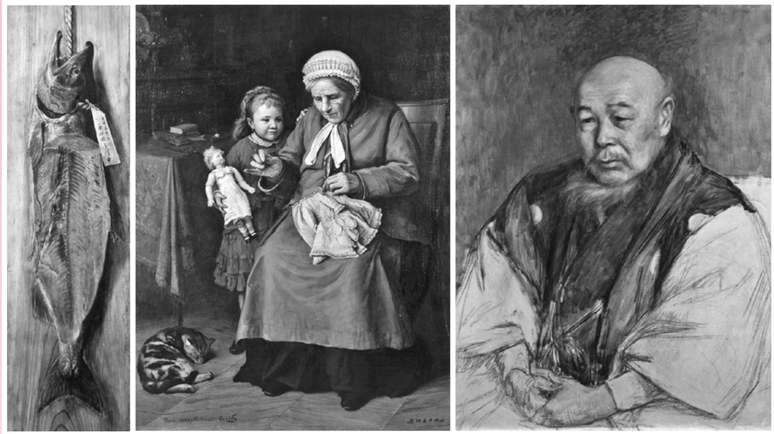
▲左から、高橋由一「鮭図」、五姓田義松「人形の着物」、黒田清輝「黒田清兼像」 [いずれも、笠間日動美術館蔵(山岡コレクション)]

ところがこの時期、 おうか 欧化主義の反動から こく 国粹主義が台頭したことによって状況が一変しました。洋画排斥の風潮が高まり、西洋系の技術文化の拠点だった工部省にも打撃を与えたのです。ついに明治16(1883)年、工部美術学校は廃校となりました。