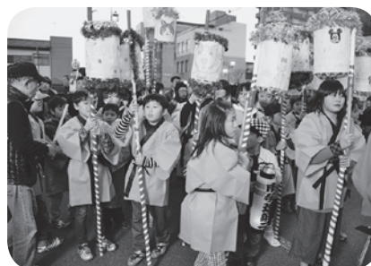
◀古河提灯竿もみまつり (子どもパレード)