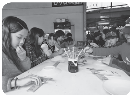
◀県西地区子ども会りー ダー研修会