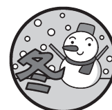
▲オリジナル凧を制作。1月に凧揚げ大会をしました

おしゃべりしながら作ったり、作ったものを見せ合ったり……。たくさんの「楽しい」「うれしい」を共有し、仲が深まりました。