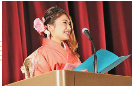
▲力強く二十歳の主張をしました