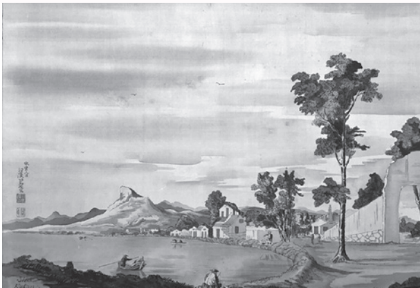
▲司馬江漢「風景」(笠間日動美術館蔵)

日本人がはじめて西洋画と出会ったのは意外に古く、キリスト教伝来の16世紀半ばまでさかのぼります。やがて徳川幕府の鎖国政策により西洋画との関わりは一度途絶えます