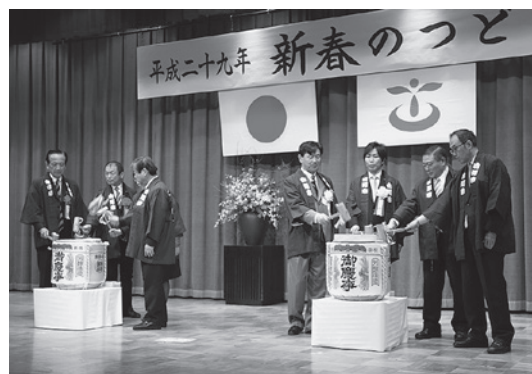
◀ 新年の抱負を語り合った「新春のつどい」

その後、市長と来賓が新しい年の始まりを祝って鏡開きを行い、全員で乾杯。会場内では、参加者が和やかに歓談する様子がみられました。