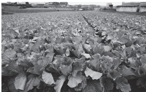
▲今年もおいしい白菜が収穫できました