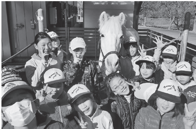
◀笑顔いっぱい のメンバー の「ポニークラブ」

厳しい寒さの中にも、春の息吹を感じられる季節になってきました。しかし、公園の人はまばらで春の訪れが待ち遠しく感じられます。