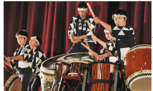
▲大迫力の太鼓演奏で新成人を祝福