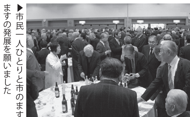
▶ 市民一人ひとりと市のますますの発展を願いました