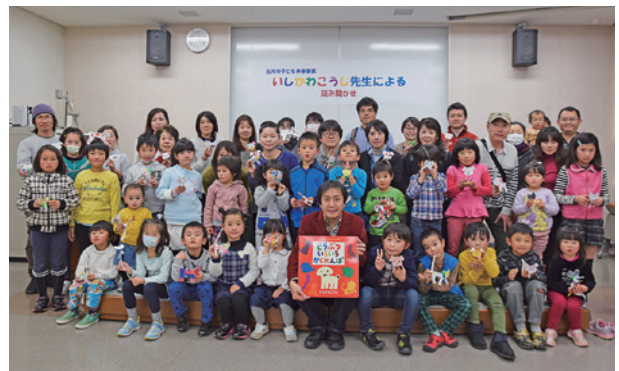
▲お父さん、お母さんと一緒に作った「ペーパーわんこ」をもってハイチーズ!

12月17日、燦SUN館(三和図書館資料館)で「子ども未来事業講演会」が行われました。