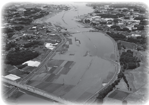
◀西仁連川決壊時の様子

堤防の復旧作業とともに農家も負けじと頑張った結果、稲穂がたわわに実った収穫の秋を迎えることができました。