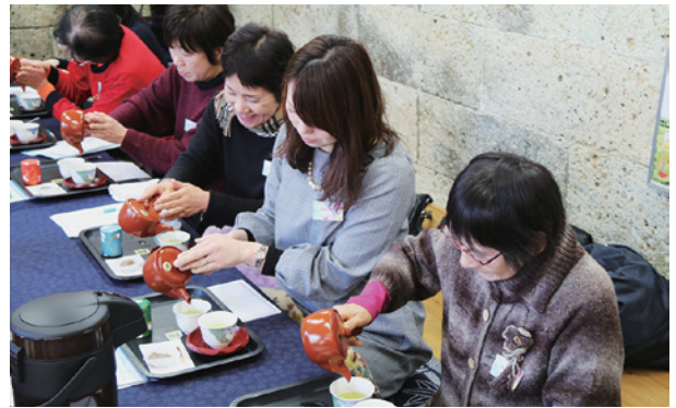
▲お湯の温度、茶葉が開くまでの時間、急須の使い方・選び方などたくさんの秘訣を教わりました

訪問客をキレイなお部屋とおいしいお茶でおもてなし。会話も笑顔もはじけることでしょう。