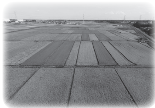
◀見事に復旧した水田