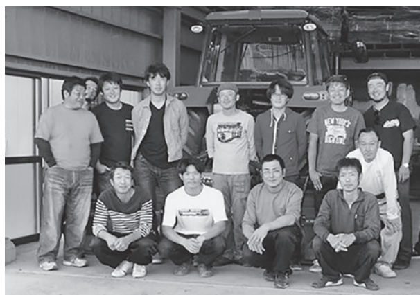
▲次世代の担い手である若手農業者たち

菜が盛んに栽培されています。この若い後継者のためにも、耕作しやすい農地にする畑地帯整備事業が始まっています。