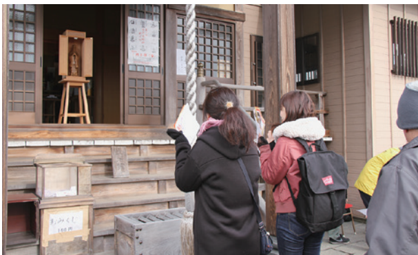
▲今年一年、皆さんが健康で幸せに過ごせますように

1月8日、「第11回古河七福神めぐり」が行われ、市内外の約3,500人が古河のまちを歩きました。