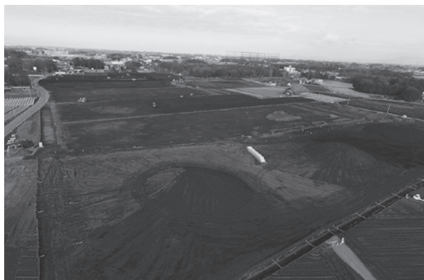
▲尾崎地区の畑地帯整備事業の全景。不整形な畑がきれいに再区画されます