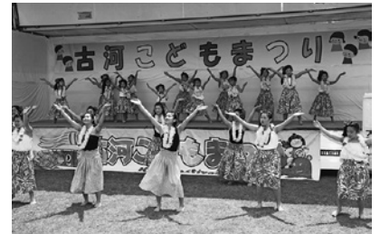
▲子どもたちが元気いっぱいのパフォーマンスします