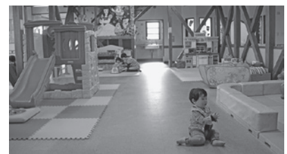
▲ネーブル子育て広場の様子