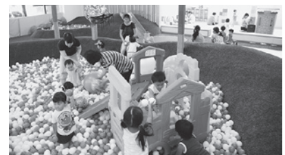
▲駅前子育て広場の様子