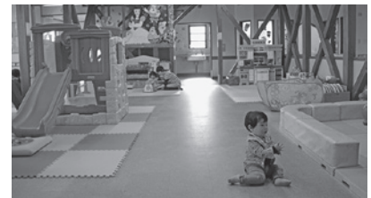
▲ネーブル子育て広場の様子