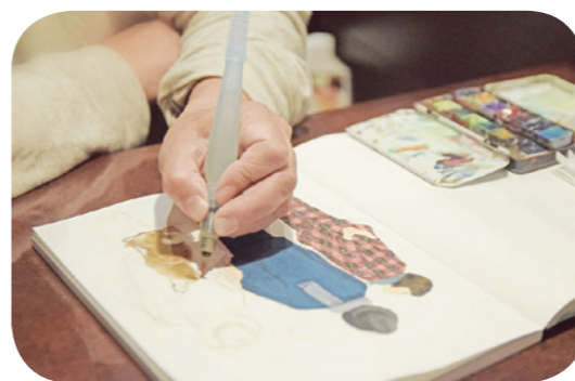
▲繊細なタッチで人物や動物を描き上げます

私の絵を通してふるさとにある魅力的な風景を多くの人に知っていただき、きっかけ作りをしていき、ふるさとの事を好きになる人が少しでも増えたらいいなと思っています。