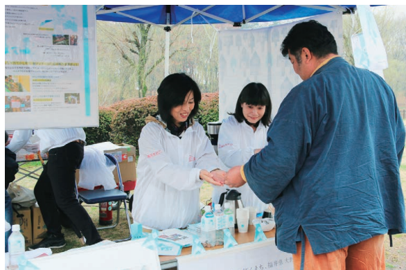
▲子どもたちが清潔で安全な水を手にすることが できるようにPR活動をする大野市役所職員 HP http://www.carrying-water-project.jp/

3月19日には「古河桃まつり」会場で、大野 市の湧き水で入れた東ティモール産のコーヒー を振る舞いながら水支援の活動をPR。多くの 来場者が熱心に耳を傾けていました。