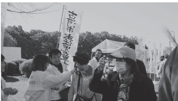
▲子どもの虐待防止運動に主任児童委員は取り組んでいます