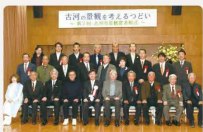
第2回古河市景観賞表彰式

不法投棄・犬のフンの立て看板作成、植込みの中の空きカン、空ビン拾いや、街路灯の電球切れの連絡等、多岐に渡り6年間継続して活動している団体である。