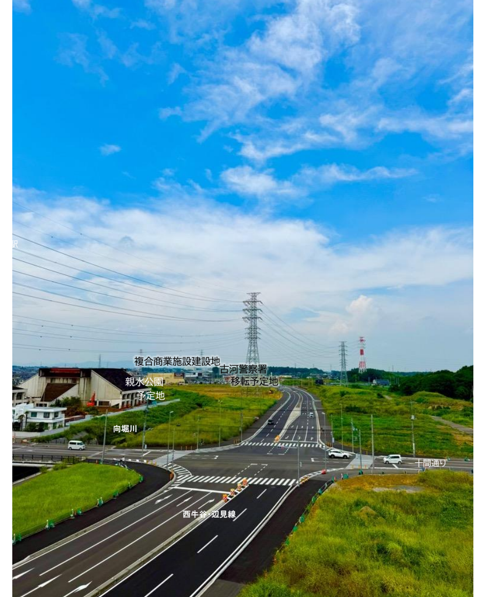
令和 7 年 8 月撮影