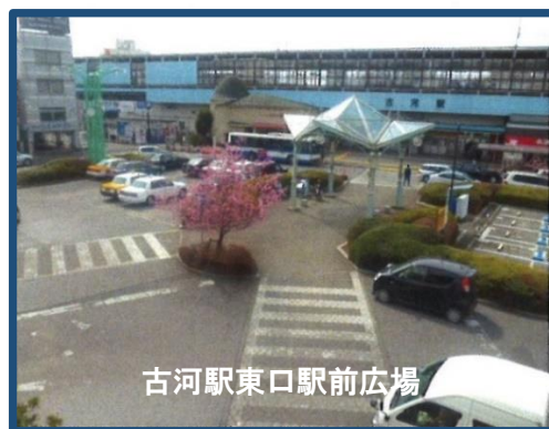
古河駅東口駅前広場