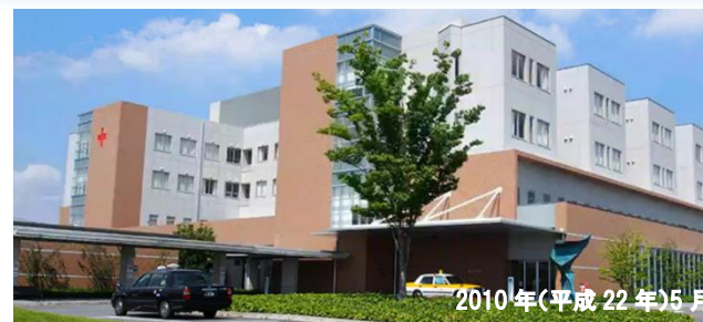
2010年(平成22年)5月 当地区 現在地に移転