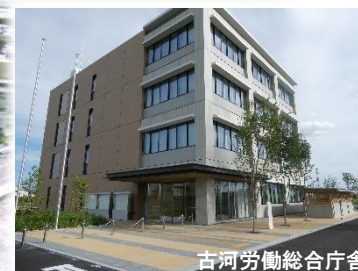
古河労働総合庁舎