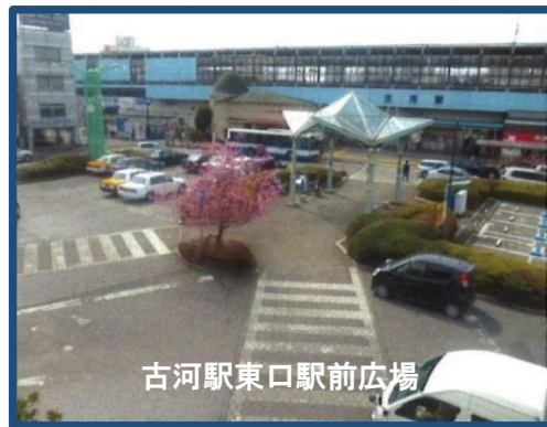
古河駅東口駅前広場