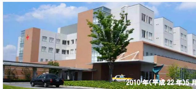
2010年(平成22年)5月 当地区 現在地に移転