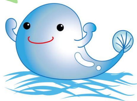
古河市水道事業キャラクター 思川みずたろう